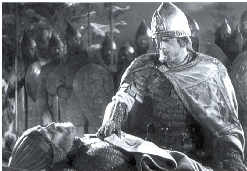
26. Александр Невский прощается с Домашем Твердиславичем. Кадр из фильма «Александр Невский» С.М. Эйзенштейна. 1938 г.