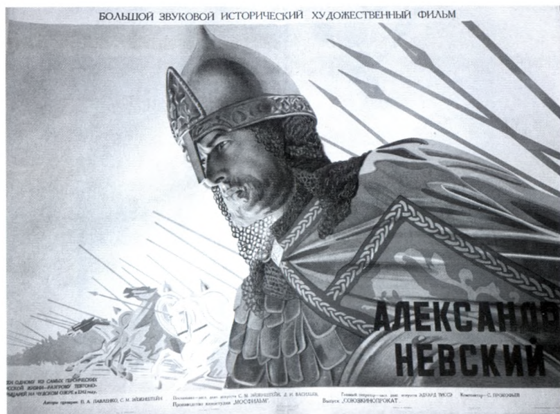
33. Александр Невский. Плакат 1938 г.