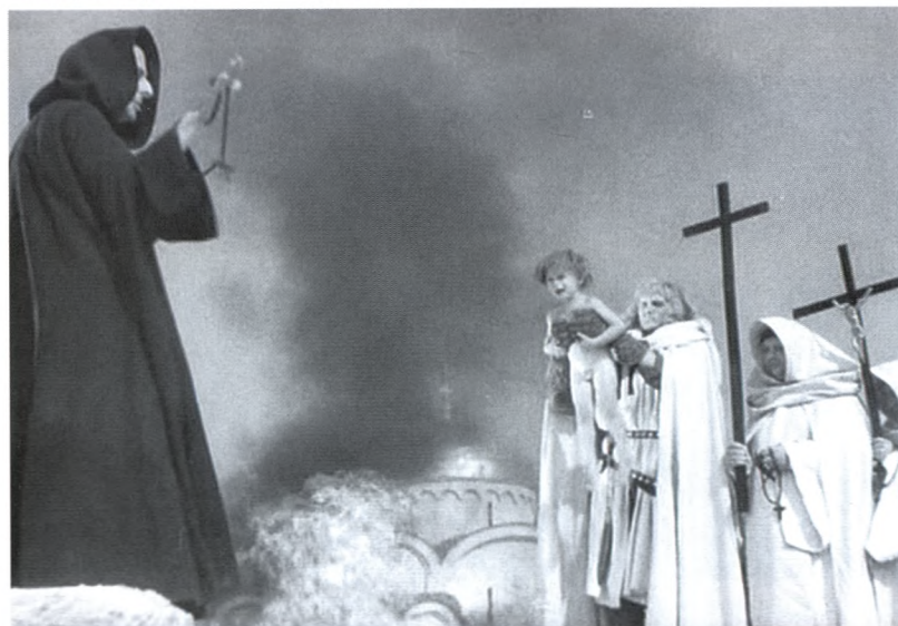
31. «Черная месса» рыцарей Тевтонского ордена во Пскове. Кадр из фильма «Александр Невский» С.М. Эйзенштейна. 1938 г.