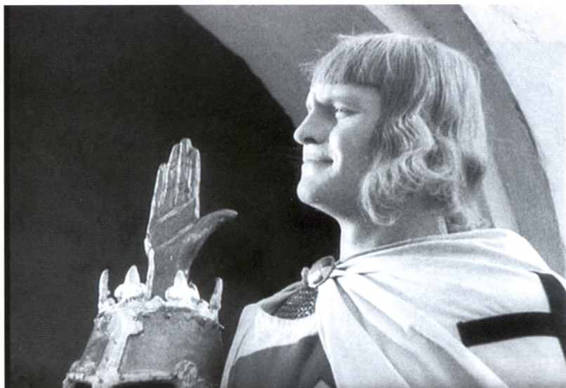
25. Рыцарь Тевтонского ордена. Кадр из фильма «Александр Невский» С.М. Эйзенштейна. 1938 г.