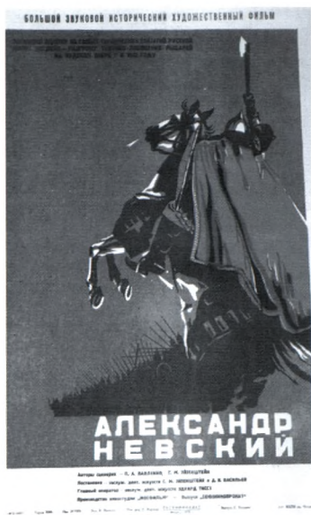
32. Александр Невский. Плакат 1938 г.