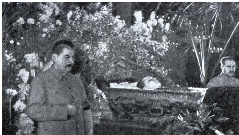
27. И.В. Сталин и Л.М. Каганович у гроба С.М. Кирова.