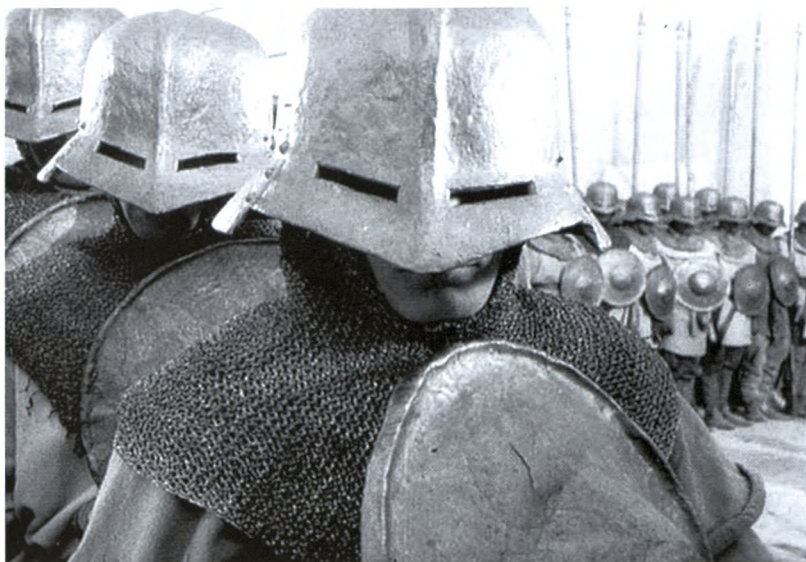
24. Кнехты Тевтонского ордена. Кадр из фильма «Александр Невский» С.М. Эйзенштейна. 1938 г.