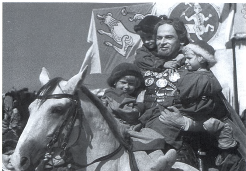
28. Въезд Александра Невского во Псков. Кадр из фильма «Александр Невский» С.М. Эйзенштейна. 1938 г.